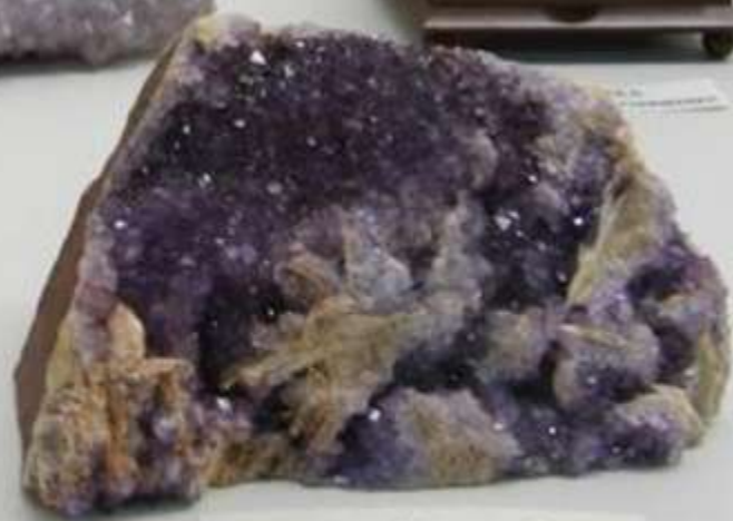
Аметист, флюорит, барит Кальский п-ов, Мыс Коробль